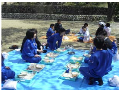
各クラス お花見給食を 楽しみました